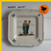
Skadedyr: Musikk! CD/LP