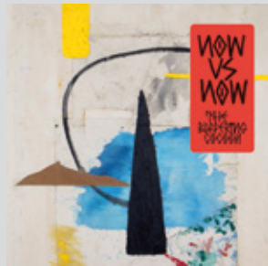
Now Vs Now - The Buffering Cocoon Now Vs Now er Lindner, Tyson og Andreou. I salg fra 1. september.