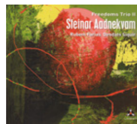
Steinar Aadnekvam Freedoms Trio II