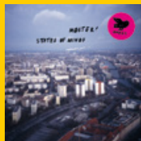
Møster!: States Of Minds 2CD/2LP