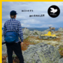
Moskus: Mirakler CD/LP