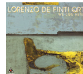
Lorenzo De Finti Qrt We Live Here

LRK Trio fra Moskva og Lorenzo DeFinti Qrt fra Italia har nye plater med slipp 12.oktober