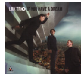
LRK Trio If You Have A Dream