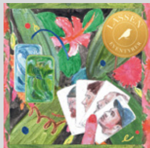
Lassen - Eventyrer Lassen, Flatjord, Andersen og De Looze. I salg fra 14. september