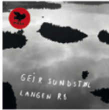
Geir Sundstøl: Langen Ro CD/LP