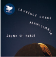
Laurence Crane / asamisimas: Sound Of Horse CD/2LP