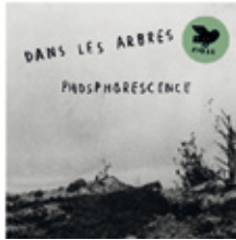
Dans Les Arbres: Phosphorescence CD/LP