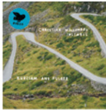
Christian Wallumrød Ensemble: Kurzsam and Fulger CD/LP